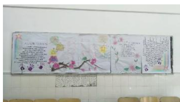
第一名: 2017级会计5班、6班 <大众创新, 万众创业>