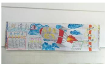
第三名: 2017级会计1班 <让梦想起飞>

此次板报创作活动,不仅增强班级成员的集体荣誉感和凝聚力,激发学生的创新能力,塑造特色,铸就班魂,还培养了学生的动手能力和审美能力,激发学生创新的智慧。